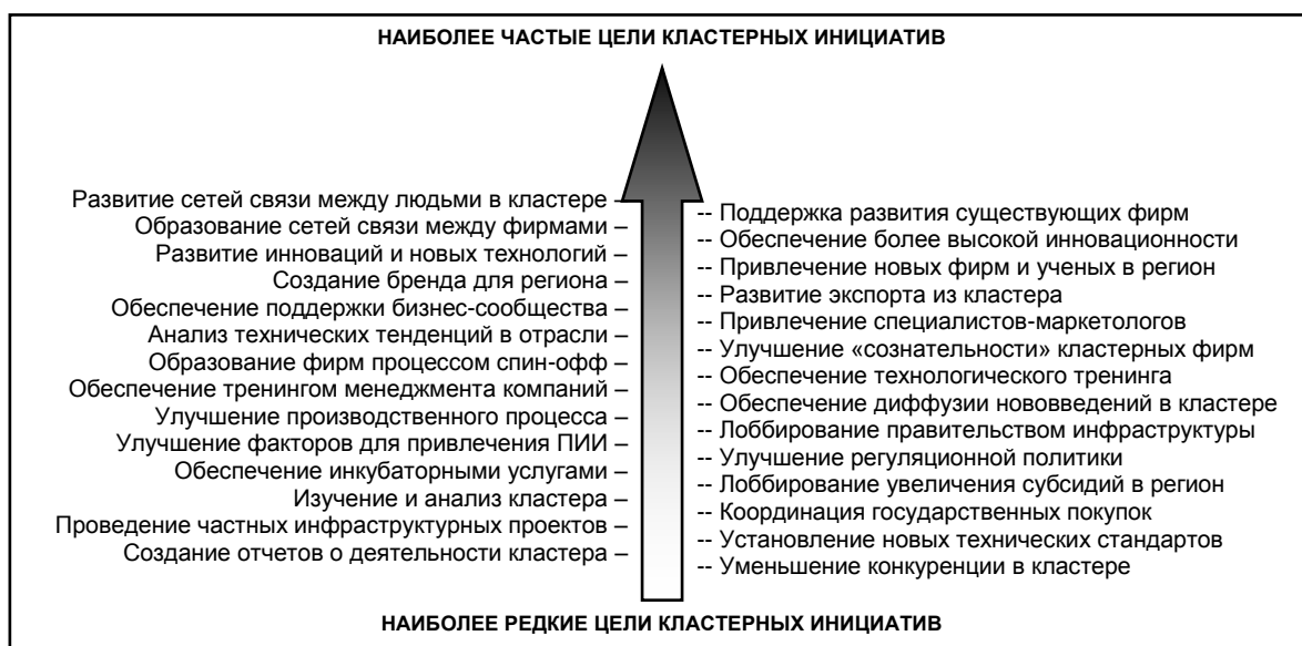
Рисунок 3. Цели осуществления кластерных инициатив за рубежом